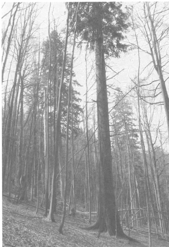
Nejmohutnější jedle v České republice roste v pralesní rezervaci Razula (Javorníky), 2007.

Celkový úbytek jedlí se projevil i na výrazném snížení počtu stromů mimořádných rozměrů. Zajímavé historické údaje z Krušnohoří uvádí Kala ( http://stromy.cea.cz/jedle ): Z jedlových kmenů o středním průměru 1 m byly zhotoveny pilíře kostela sv. Jáchyma, postaveného v letech 1534-1540 v Jáchymově. Zanikly při požáru města v r. 1873. Ještě v roce 1650 byly podle starých mysliveckých letopisů u Potůčků káceny jedle, které měly na pařezu obvod osm až deset metrů. Z poloviny 19. století se dochovaly záznamy o plavení třístaletých jedlí po Ohři na stožáry pro hamburské